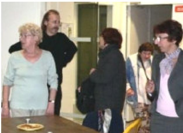
Les premiers arrivés entament déjà les discussions...

L'association a regroupé 45 d'adhérents actifs et sympathisants lors de cette dernière saison.