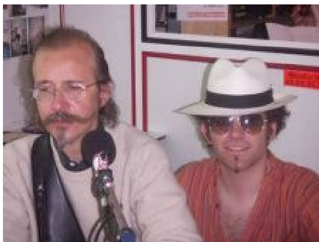
Tenue d'été à Radio Fajet

Les groupes se succèdent de demi-heure en demi-heure, l'ambiance est sympathique et les animateurs vous écoutent parler (les auditeurs aussi, espérons-le...)