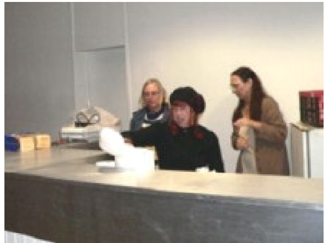
Préparation de la salle (et du bar !) par les plus actives des adhérentes...