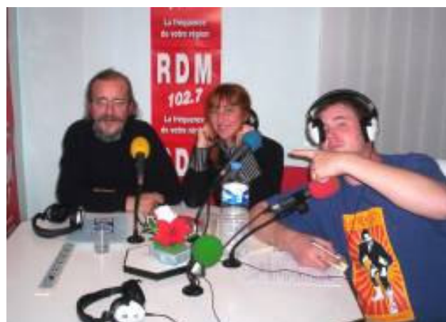
Montrés du doigt...