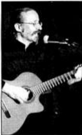
Un hommage à Julos Beaucarne et aux poètes.