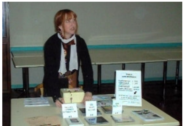
Chant, mais aussi billetterie et vente de CD et livres pour Elise...

Une heure et demie de poésie et le public en redemandait ! Il faut dire que la salle terriblement polyvalente, mise gracieusement à notre disposition par la municipalité, avait fait le plein d'adhérents de l'association « Anonyme... et moins si affinités ». Sans oublier les inconditionnels amis du forum de Julos, certains ayant eu des empêchements de dernière minute, d'autres étant présents ce soir-là, venus de la