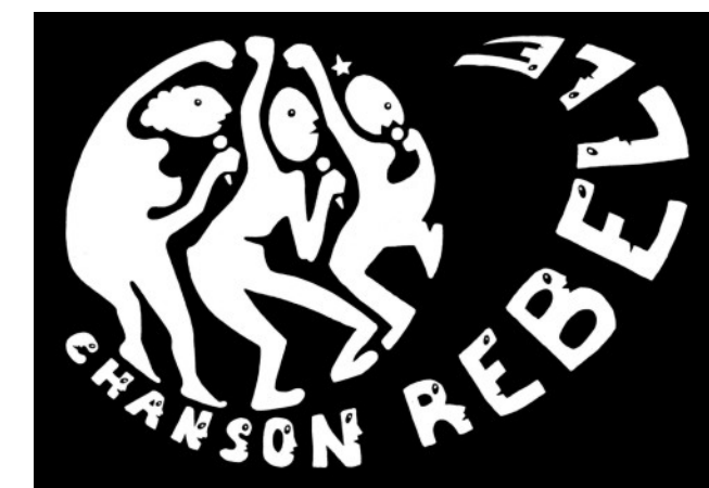
Graphisme : Pascale Ramsay