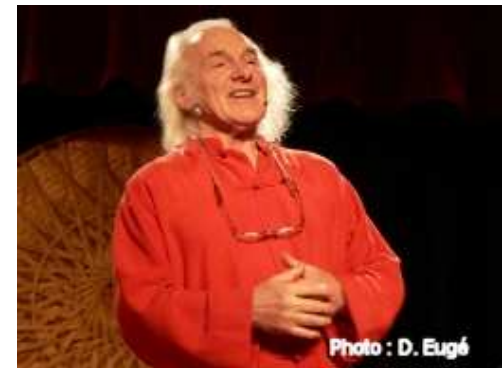
Le Jaseur Boréal à Champigneulles...